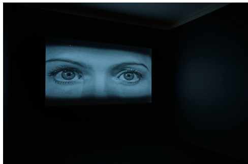
© Susan MacWilliam, Installationsansicht KATHLEEN , 2014 Video im Loop (S/W, Ton): 33'

Ausstellung: Künstlerhaus 1050, Stolberggasse 26, 1050 Wien, 16.2. – 14.4.2018