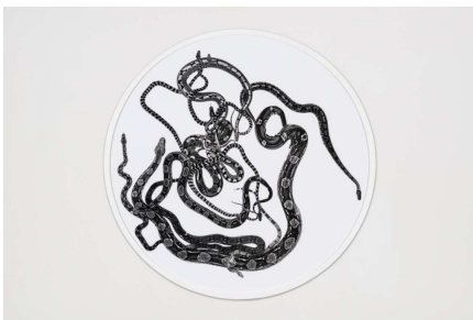
© Gabriele Rothemann, Schlangenmosaik I , 2012 Fotografie auf Barytpapier, ø 131,5 cm

Diese Bilder dürfen nur in Verbindung mit der Ausstellung „EIKON Award (+45)“ und den gekennzeichneten Copyrights verwendet werden!