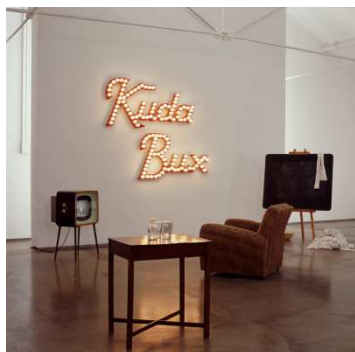
© Susan MacWilliam, Installationsansicht, Kuda Bux , 2003, Ormeau Baths Gallery, Belfast, 2003; Installation mit Video (S/W, Farbe, Ton): 10'40" Courtesy of CONNERSMITH