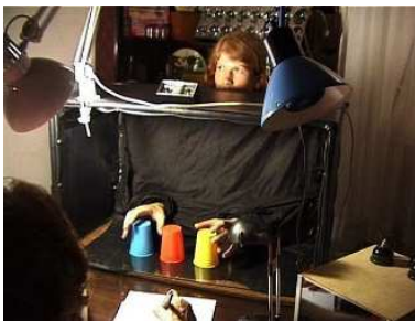
© Susan MacWilliam, Dermo Optics , 2006 Video (Farbe, Ton): 4'9"