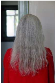
© Katrín Elvarsdóttir, Woman in Red Coat , 2008 aus der Serie Equivocal Archivpigmentdruck, 85 x 57 cm