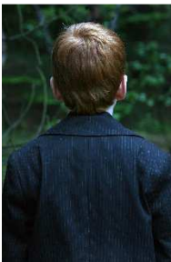
© Katrín Elvarsdóttir, Boy in Woods , 2008 aus der Serie Equivocal Archivpigmentdruck, 85 x 57 cm