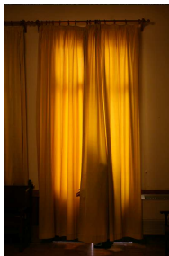
© Katrín Elvarsdóttir, Yellow Curtain 3 , 2009 aus der Serie Equivocal Archivpigmentdruck, 85 x 57 cm