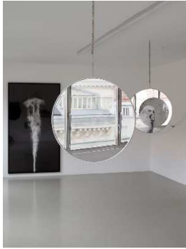
© Gabriele Rothemann, Wellensittichspiegel , 2016 Digitaldruck auf Spiegel, je ø 71cm