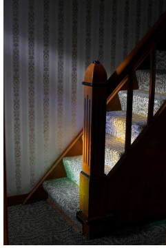
© Katrín Elvarsdóttir, Vanished Summer 6 , 2012 aus der Serie Vanished Summer Archivpigmentdruck, 55 x 75 cm