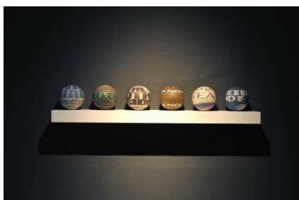
© Susan MacWilliam, Ausstellungsansicht Book Spheres , in Psychic Lighthouse , Model Arts, Sligo, 2015 Foto: Heike Thiele Courtesy of CONNERSMITH