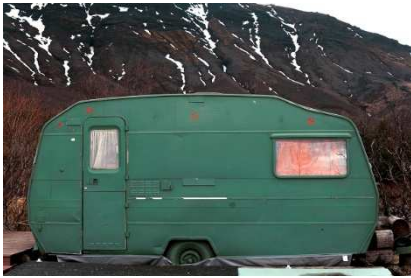
© Katrín Elvarsdóttir, Vanished Summer 17 , 2012 aus der Serie Vanished Summer Archivpigmentdruck, 55 x 75 cm