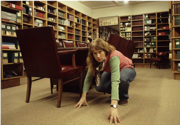
© Susan MacWilliam, Artist as Medium , 2008 stereoskopisches Bild, Selbstportrait in der Eileen J. Garrett Library, Parapsychology Foundation, New York Courtesy of CONNERSMITH