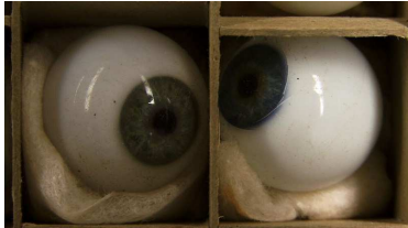
© Susan MacWilliam, Aldous's Eyes , 2014 Video Still (Farbe, ohne Ton) Courtesy of CONNERSMITH