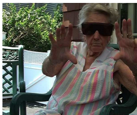
© Susan MacWilliam, Eileen , 2008 Video Still, synchronisierte Dreikanal- Videoinstallation (Farbe, Ton, Stereo)