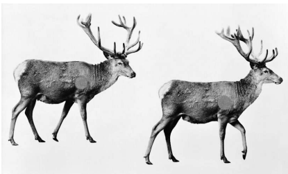
© Gabriele Rothemann, Doppelhirsch , 1997 Fotografie auf Barytpapier 110,5 x 238,5 cm