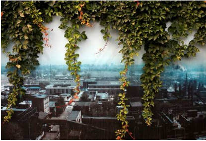
© Katrín Elvarsdóttir, Double Happiness 11 , 2013 aus der Serie Double Happiness Archivpigmentdruck 55 x 75 cm