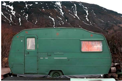
© Katrín Elvarsdóttir, Vanished Summer 17 , 2012 aus der Serie Vanished Summer Archivpigmentdruck je 55 x 75 cm